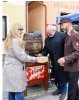
Segnung des neuen MTFs, Ehrungen und Oktoberfest.