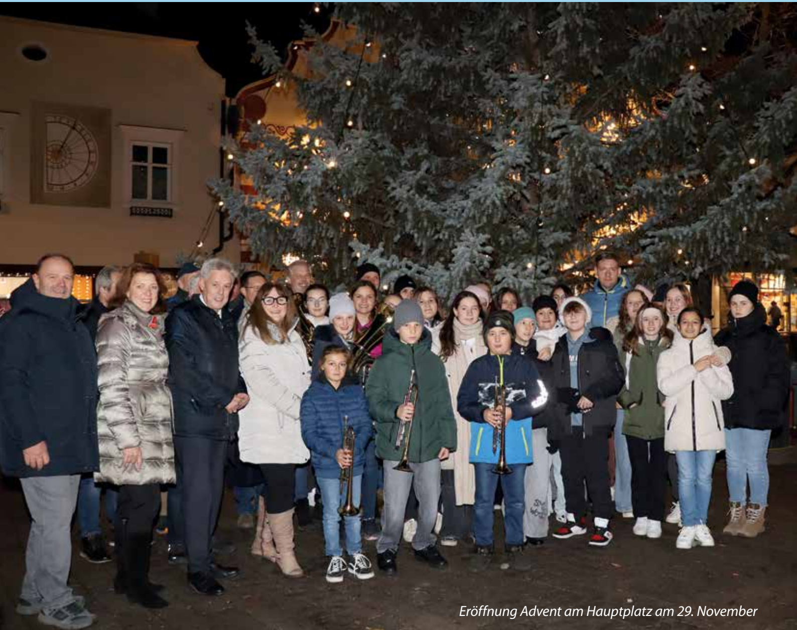
Eröffnung Advent am Hauptplatz am 29. November

Frohe Weihnachten und einen guten Start in das Neue Jahr 2025