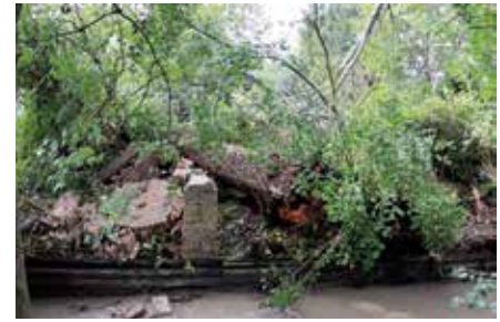
Der Sturm im September hat vor allem im Stadtpark enormen Schaden angerichtet.

Wir bedanken uns nochmals herzlich bei jenen Personen, die heuer Bäume gespendet haben: den Veranstalter der MOTRO, der Siedlungsgenossenschaft Neunkirchen und den BewohnerInnen der Zeil!